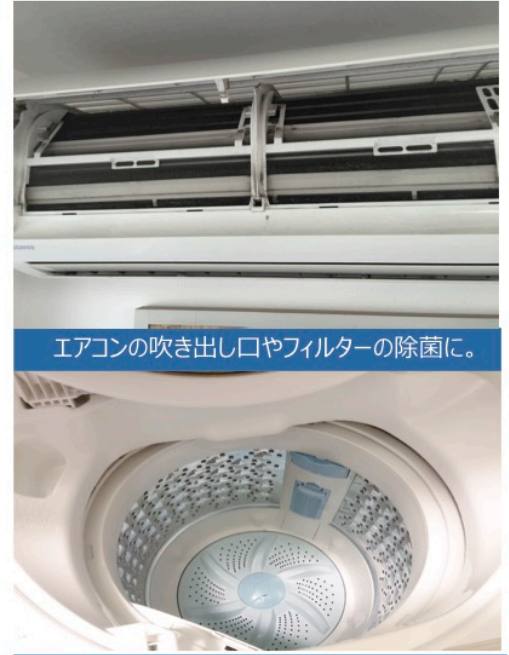
エアコンの吹き出し口やフィルターの除菌に。