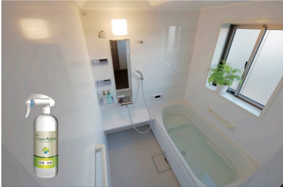
お風呂のタイルや目地に付着している頑固なクロカビ対策に！